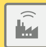
ГУДКИ ПРЕДПРИЯТИЙ И ТРАНСПОРТНЫХ СРЕДСТВ