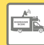
ПОДВИЖНЫЕ ЗВУКОУСИЛИТЕЛЬНЫЕ УСТАНОВКИ