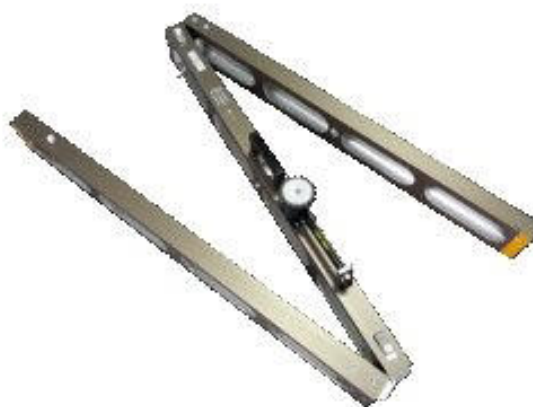
Рейка дорожная универсальная РДУ-АНДОР