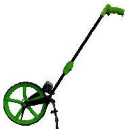
Курвиметр дорожный КП-230м РДТ