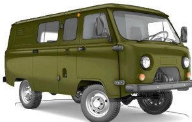
Лаборатория на базе УАЗ-390995