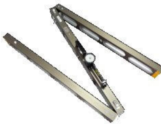
Рейка дорожная универсальная РДУ-АНДОР