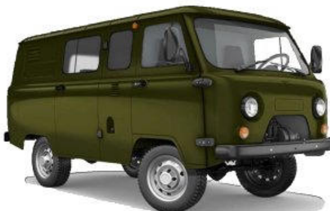
Лаборатория на базе УАЗ-390995