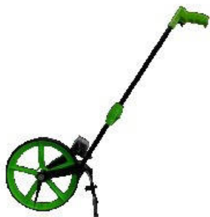
Курвиметр дорожный КП-230м РДТ